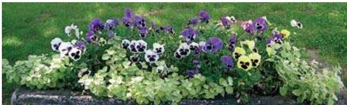
Bratki i kocanki włochate posadzone w starym kamiennym pojemniku dopełniają się kolorystycznie.

plektrantus koleusowaty pustynnik smagliczka nadmorska tulipan tytoń (Sandera, oskrzydłony)