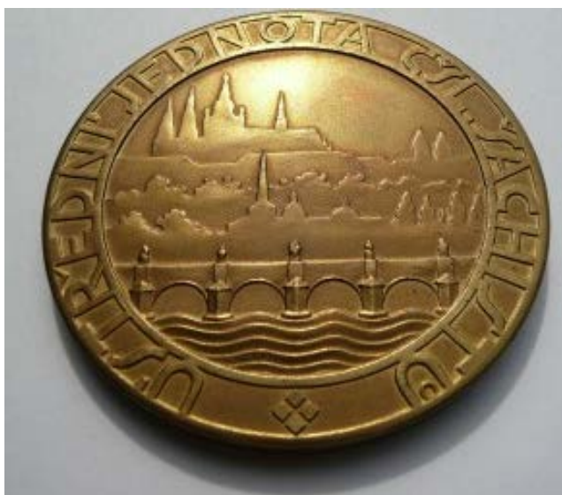
Zdjęcia: Medale olimpijskie