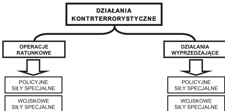
Ryc. 2. Główne podmioty państwa odpowiedzialne za działania reaktywne