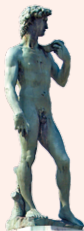
▲ Dawid, rzeźba Michała Anioła – kopia na Piazzale Michelangelo we Florencji

W 1801 r. Napoleon podbił Toskanię i utworzył Królestwo Etrurii. W latach 1807–1809 region był nawet częścią Francji. Początek XIX w. to na całym Półwyspie Apenińskim okres budzenia się nastrojów narodowych oraz dążeń do zjednoczenia państwa, do któ-