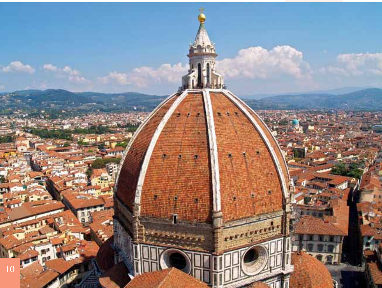
▼ Renesansowa kopuła gotyckiej katedry we Florencji