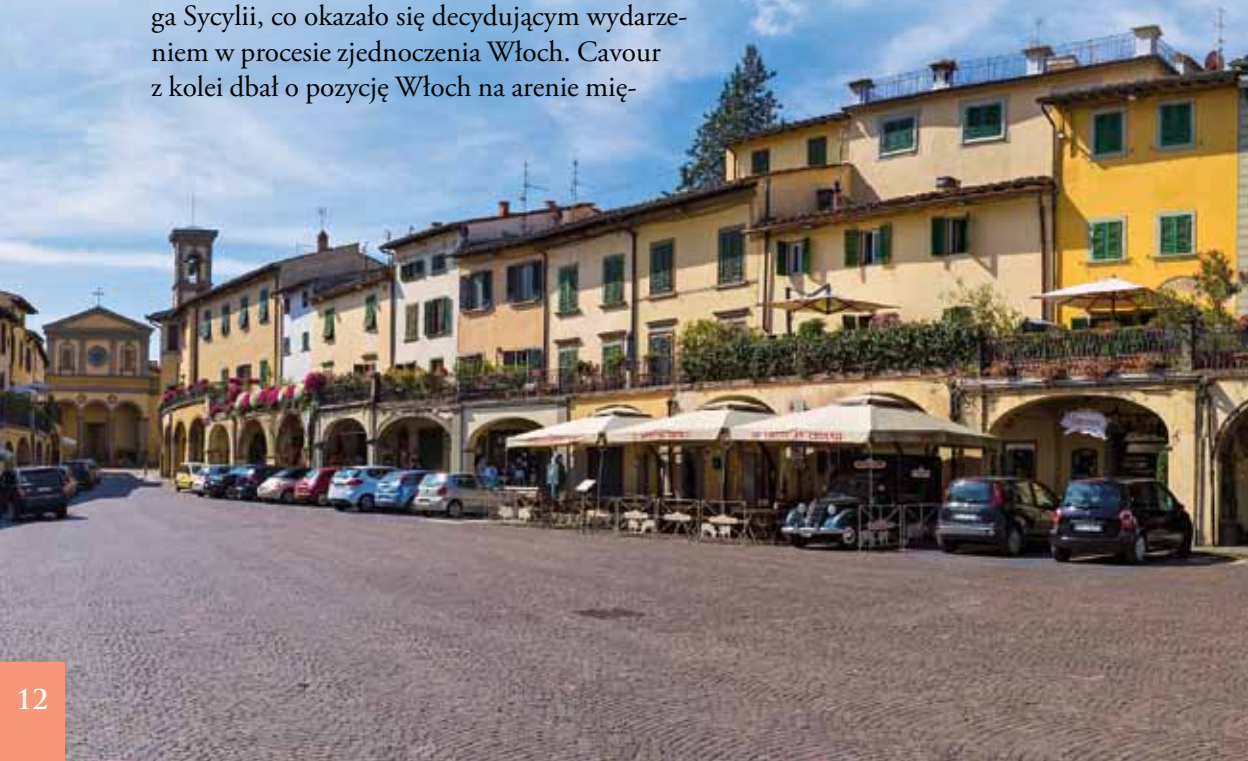
▼ Wiele tokańskich ulic i placów nosi imiona włoskich bohaterów narodowych. Należy do nich również Piazza Matteotti w Greve in Chianti

To właśnie w okresie Risorgimento (zjednoczenia Włoch) należy doszukiwać się genezy nazw większości placów w całym kraju. Place (piazza) i ulice (via) upamiętniające ojców ojczyzny – Giuseppe Mazziniego, Giacomina Matteottiego, Camilla Cavoura i Giuseppe Garibaldiego – istnieją chyba w każdym włoskim mieście i miasteczku. Wszystkie te nazwiska wiążą się właśnie z kształtowaniem państwowości w Italii. Mazzini był rewolucjonistą i patriotą, który przyczynił się do zjednoczenia Włoch. Opowiadał się za stworzeniem jednego państwa włoskiego w ramach republiki. Garibaldi zapisał się jako bohater słynnej wyprawy tysiąca ochotników, podczas której zmusił do ucieczki władcę Królestwa Obojga Sycylii, co okazało się decydującym wydarzeniem w procesie zjednoczenia Włoch. Cavour z kolei dbał o pozycję Włoch na arenie mię-