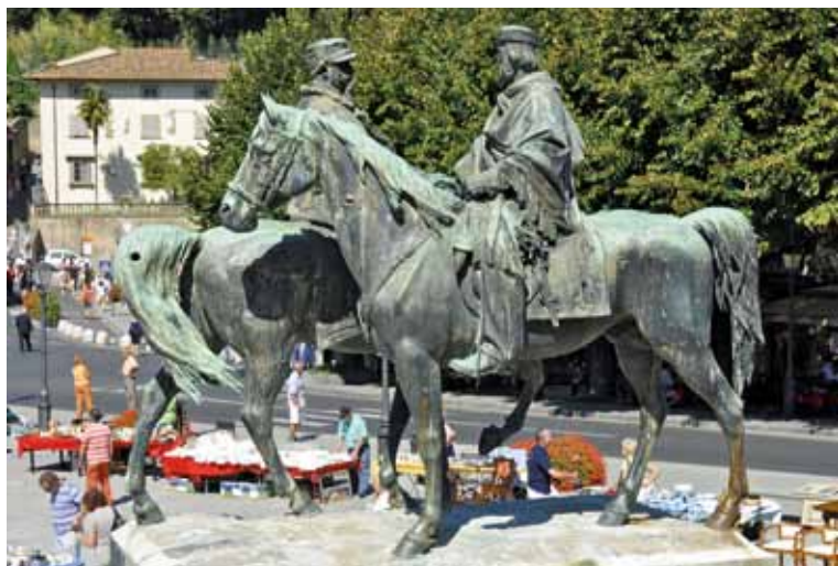
◀ Pomnik spotkania Giuseppe Garibaldiego z królem Wiktorem Emanuelem II (Fiesole)

To właśnie w okresie Risorgimento (zjednoczenia Włoch) należy doszukiwać się genezy nazw większości placów w całym kraju. Place (piazza) i ulice (via) upamiętniające ojców ojczyzny – Giuseppe Mazziniego, Giacomina Matteottiego, Camilla Cavoura i Giuseppe Garibaldiego – istnieją chyba w każdym włoskim mieście i miasteczku. Wszystkie te nazwiska wiążą się właśnie z kształtowaniem państwowości w Italii. Mazzini był rewolucjonistą i patriotą, który przyczynił się do zjednoczenia Włoch. Opowiadał się za stworzeniem jednego państwa włoskiego w ramach republiki. Garibaldi zapisał się jako bohater słynnej wyprawy tysiąca ochotników, podczas której zmusił do ucieczki władcę Królestwa Obojga Sycylii, co okazało się decydującym wydarzeniem w procesie zjednoczenia Włoch. Cavour z kolei dbał o pozycję Włoch na arenie mię-