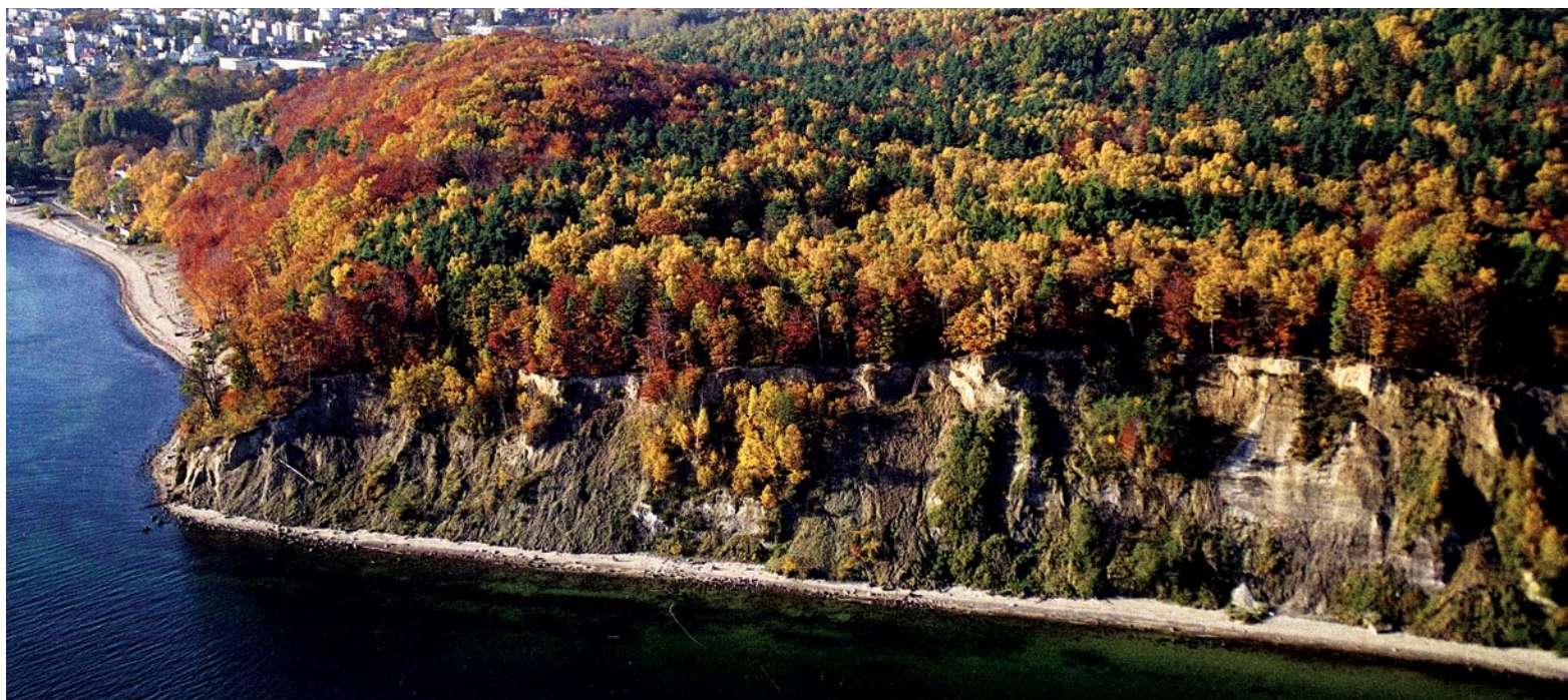
Klif Orłowski (Gdynia Orłowo)

Najpiękniejsze odcinki wysokiego wybrzeża klifowego występują zarówno we wschodniej, jak i zachodniej części polskiego wybrzeża. Znanie i podziwane przez turystów klify wznoszą się w rejonie przylądka Rozewie i Jastrzębiej Góry na Pobrzeżu Kaszubskim. W Międzyzdrojach na wyspie Wolin wysokie na 95 m klifowe urwisko rozwinęło się na zboczu góry Gosań. Z jego wierzchołka roztacza się spektakularny widok na brzeg morski, widoczne są bliższe i dalsze fragmenty brzegów Zatoki Pomorskiej, zarysy budynków Międzyzdrojów, a w bliższym planie klif, buczyny oraz sosny. Wysokie klify Wolinu rozwinięte są w obrębie graniczącej z morzem strefy wzgórz moreny czołowej, powstałej w końcowej fazie ostatniego zlodowacenia. Morze niszczące wysokie brzegi nieubłaganie pochłania ląd, dlatego woliński klif cofa się średnio o 1 m każdego roku. Wybrzeże wyspy oraz przylegające do niego od południa obszary morenowe to teren chroniony w Wolińskim Parku Narodowym. Na tym obszarze powyżej