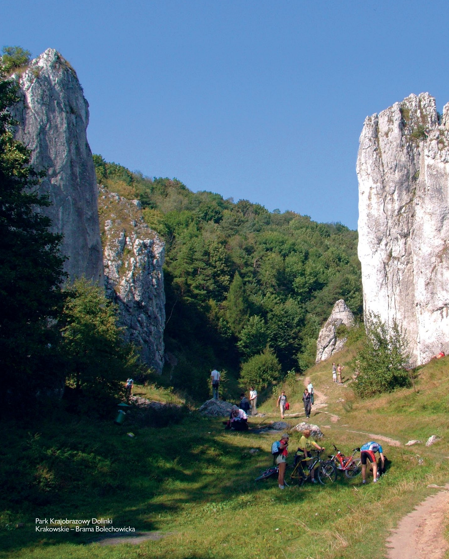
Park Krajobrazowy Dolinki Krakowskie – Brama Bolechowicka