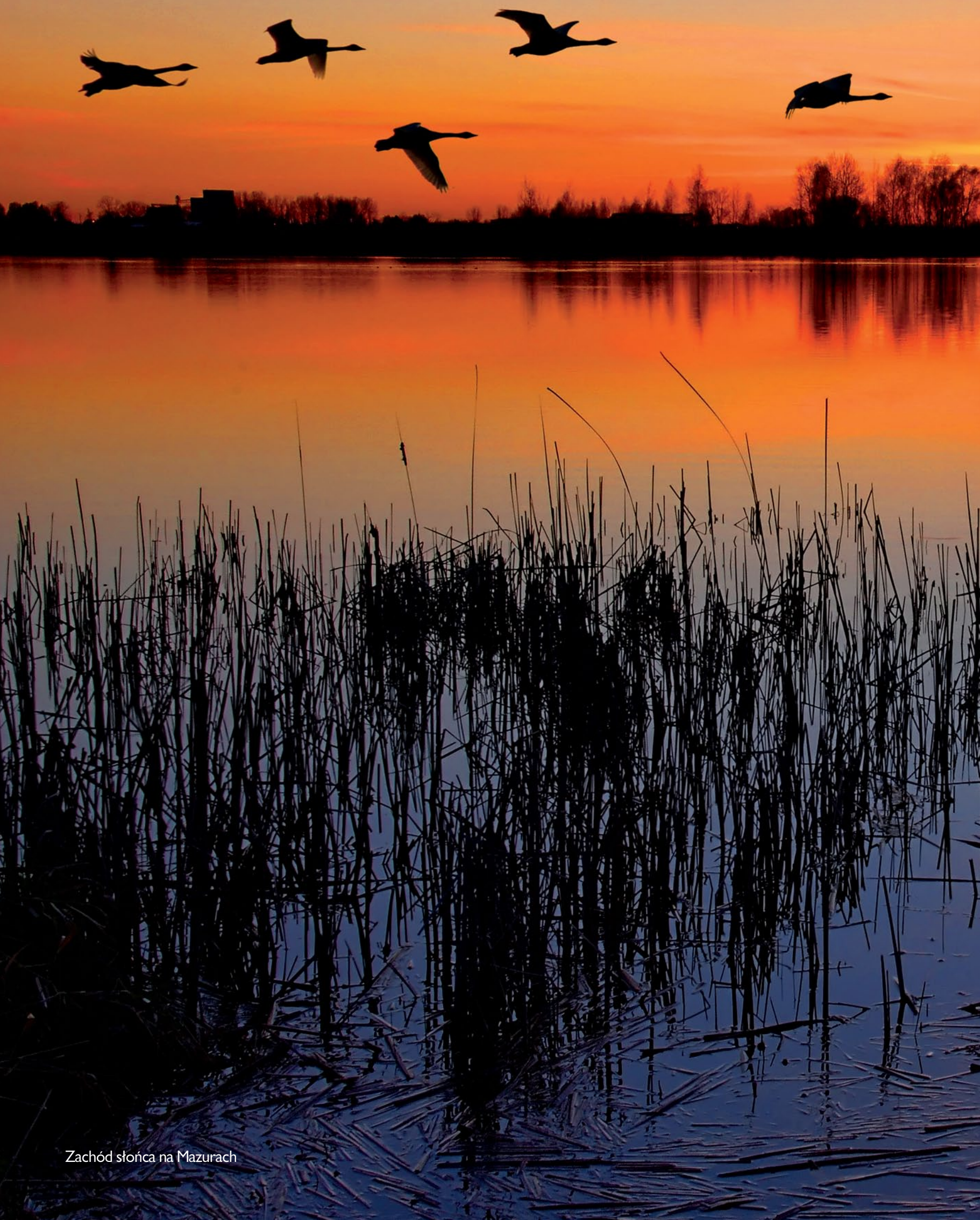
Zachód słońca na Mazurach