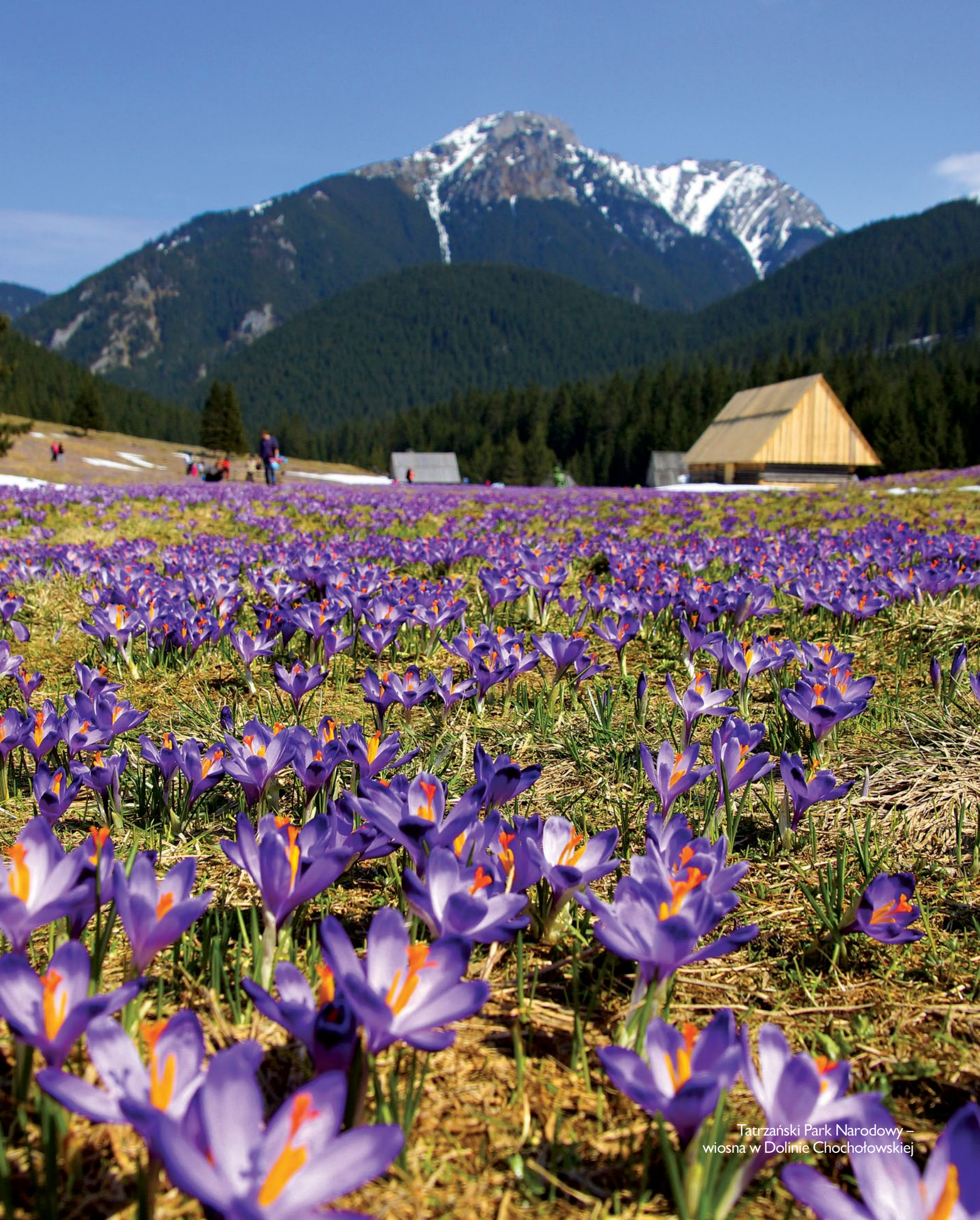
Tatrzański Park Narodowy – wiosna w Dolinie Chochołowskiej