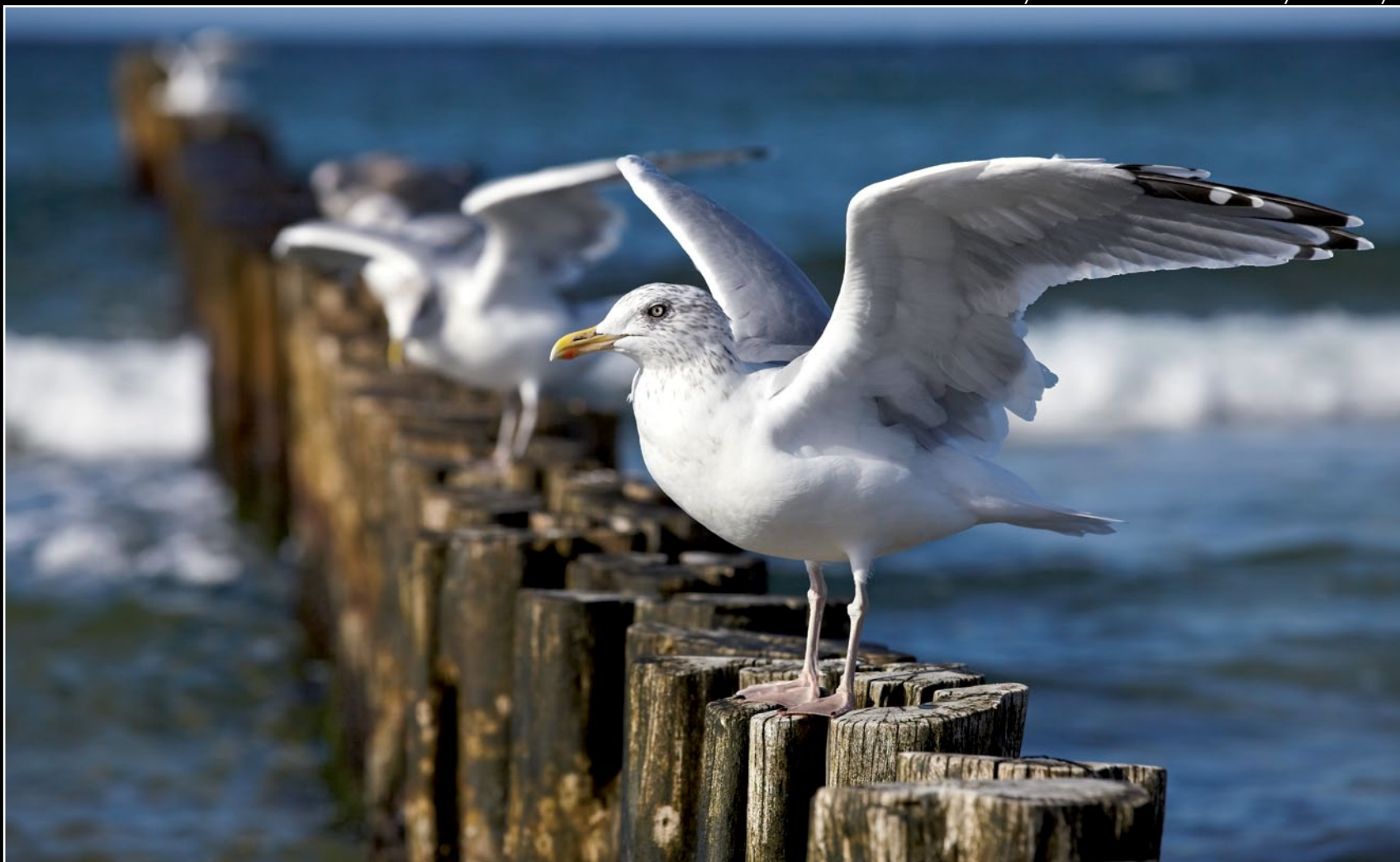
Mewy na falochronie na niemieckim wybrzeżu Bałtyku