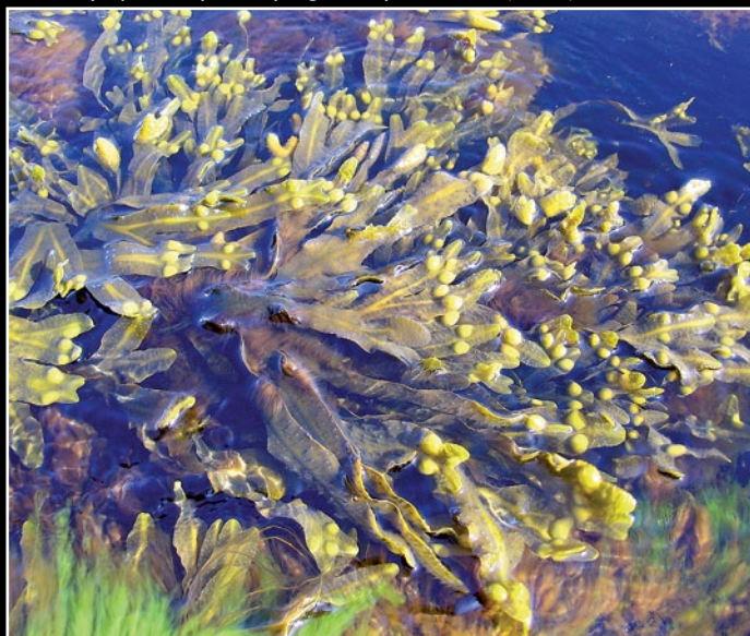
Morszczyń pęcherzykowy z gromady brunatnic (Dania)

Fitobentos to rośliny porastające przybrzeżne partie morskiego dna. W Bałtyku występują zielenice (np. gałęzatką), brunatnice (np. morszczyń), krasnorosty (np. widlik) oraz rośliny kwiatowe (np. trawa morska).