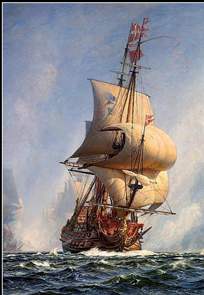
Duński okręt flagowy Christianus Qvintus podczas bitwy o Køge Bay w 1677 r. (fragment obrazu Christiana Mølstedta)

szukiwaniu niewolników. Od średniowiecza nadmorskie porty zaczęły mieć znaczenie przede wszystkim handlowe i tak już zostało do dziś, zmieniały się jedynie towary, które ładowano na statki. Konflikty o panowanie na Morzu Bałtyckim wybuchały wtedy, gdy któremuś z państw zamarzyła się hegemonia i całkowita kontrola nad szlakami handlowymi, a co za tym idzie – zagarnięcie wszystkich wynikających z tego zysków.