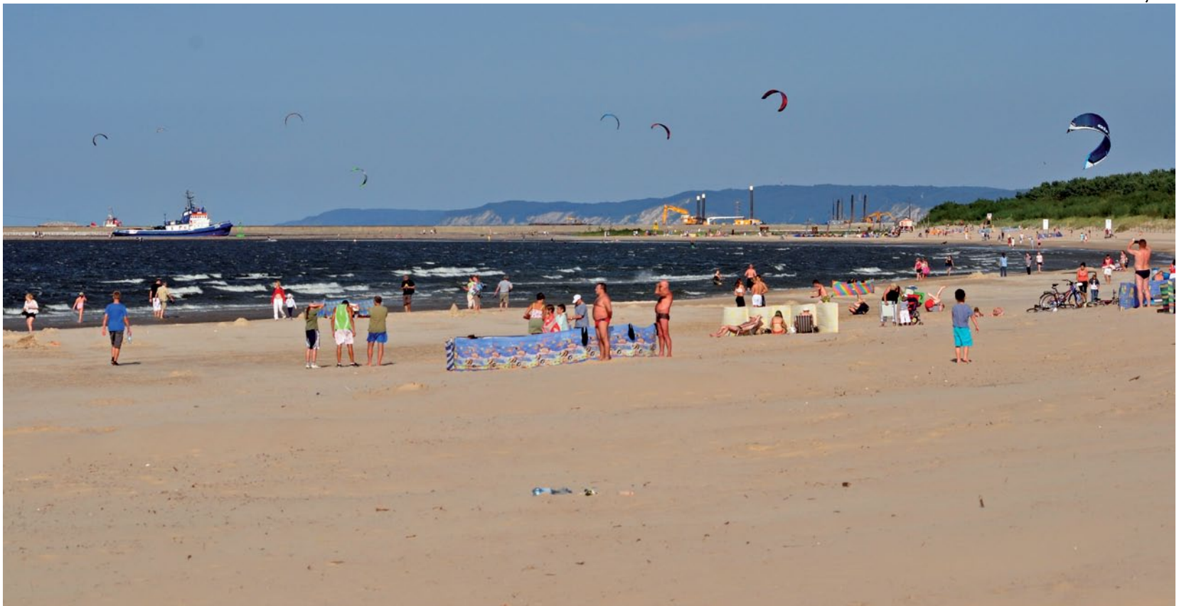
Plaża w Świnoujściu