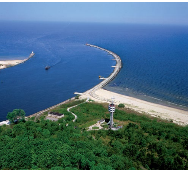
Ujście Świny w Świnoujściu rozdzielające wyspy Wolin i Uznam