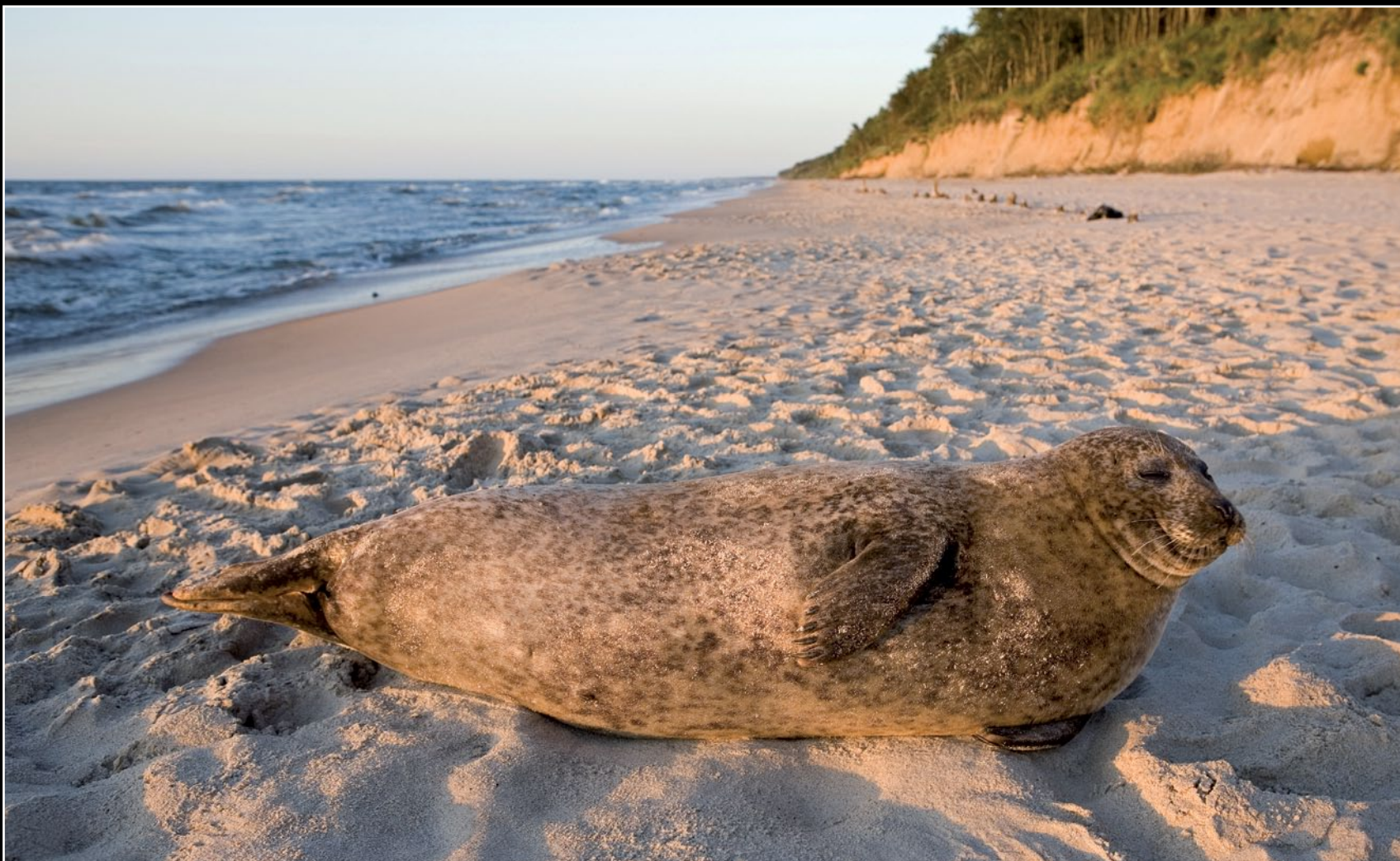
Foka pospolita na plaży wyspy Wolin