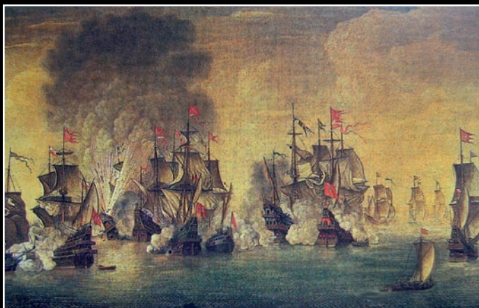
Bitwa pod Oliwą – bitwa morską między flotami polską i szwedzką w 1627 r. (fragment obrazu Stefana Płużańskiego)

Znaczenie Bałtyku zawsze było bardzo duże. W starożytności na bałtyckim wybrzeżu pozyskiwano bursztyn, ceniony przez ówczesnych mieszkańców basenu Morza Śródziemnego na równi ze złotem. Wyprawiano się także w te rejony w po-