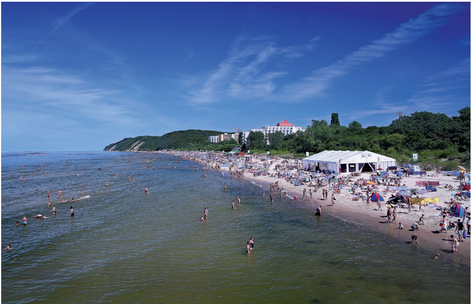
Plaża w Międzyzdrojach