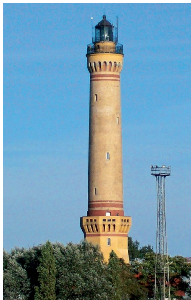
Latarnia morska w Świnoujściu