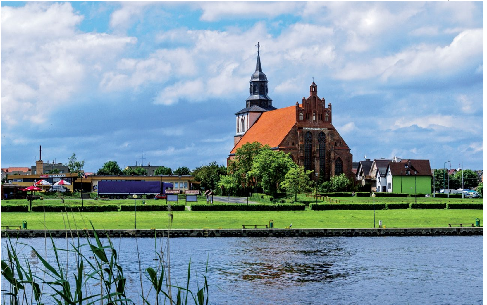
Katedra św. Mikołaja w Wolinie