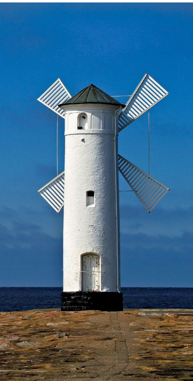
Stawa Młyny w Świnoujściu

W olin, największa polska wyspa (powierzchnia: 265 km 2 ), leży między Zatoką Pomorską a Zalewem Szczecińskim. Od wyspy Uznam oddziela ją rzeka Świna, a od lądu rzeka Dziwna i Zalew Kamieński. Do Polski należy także część sąsiedniej wyspy Uznam (90 km 2 ; pozostała część znajduje się w granicach Niemiec).