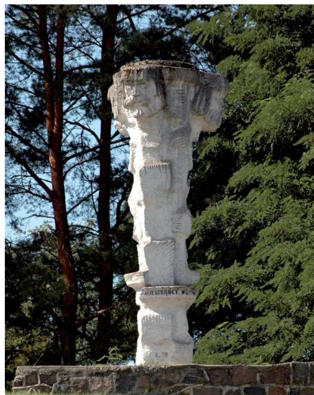
Posąg Trygława w Wolinie