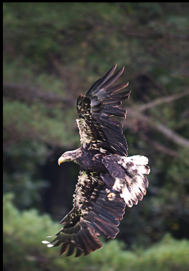
Orzeł przedni ( Aquila chrysaetos )

Po uratowaniu przed wyginięciem kozic, koziorożców i świstaków w kilku alpejskich parkach narodowych przystąpiono do reintrodukcji orłów, sępów, a nawet wilków. Możliwe że już za kilkanaście lat będzie można podziwiać wielkie ptaki szybujące nad górami. Piękniej jest, gdy podczas wycieczki spotkamy sarny, wiewiórki, głuszca lub wydrę. A widok pasących się przy ścieżce koziorożców lub baraszkujących świstaków uświadamia, jak wiele stracilibyśmy, gdyby w górach zabrakło roślin i zwierząt.