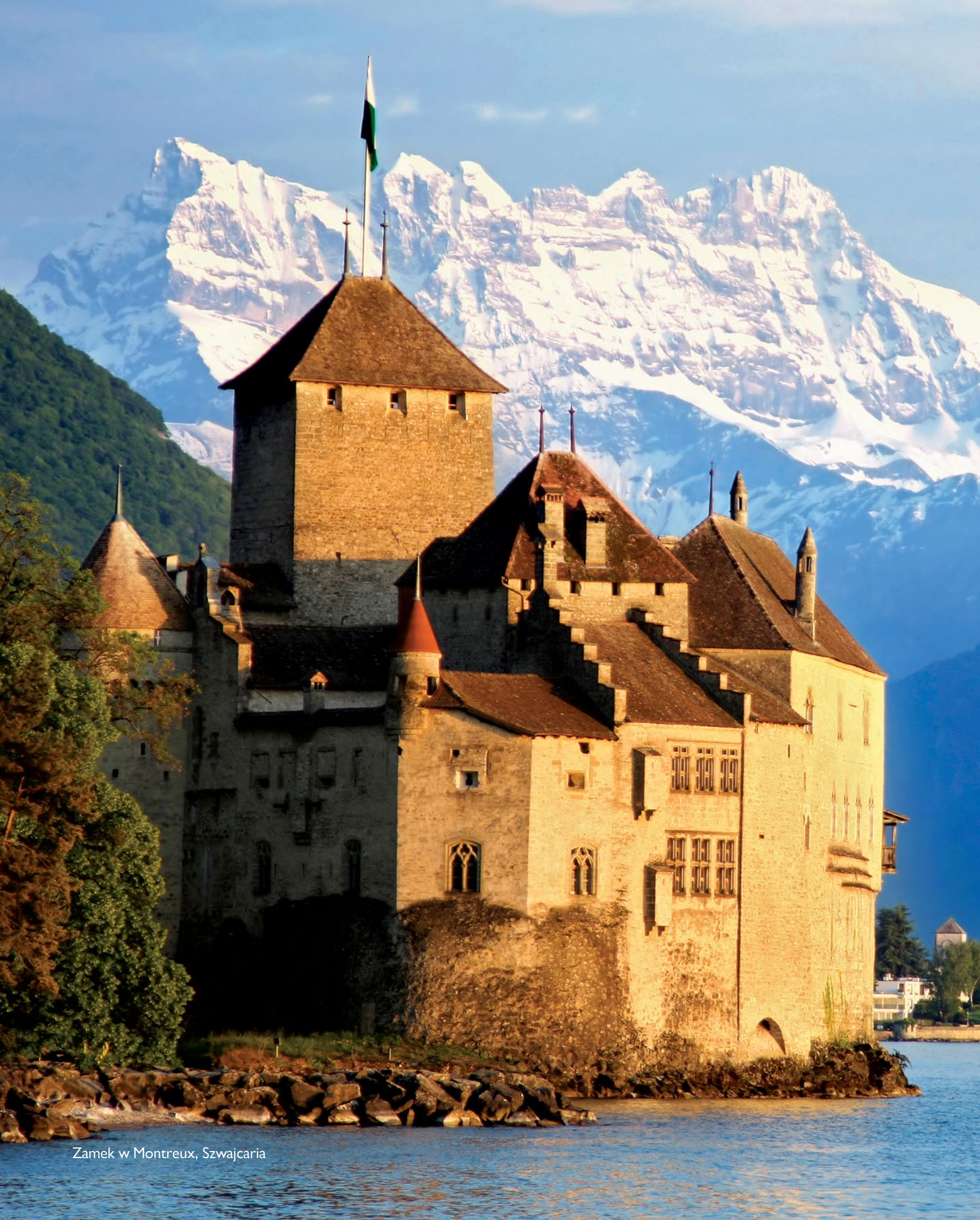
Zamek w Montreux, Szwajcaria