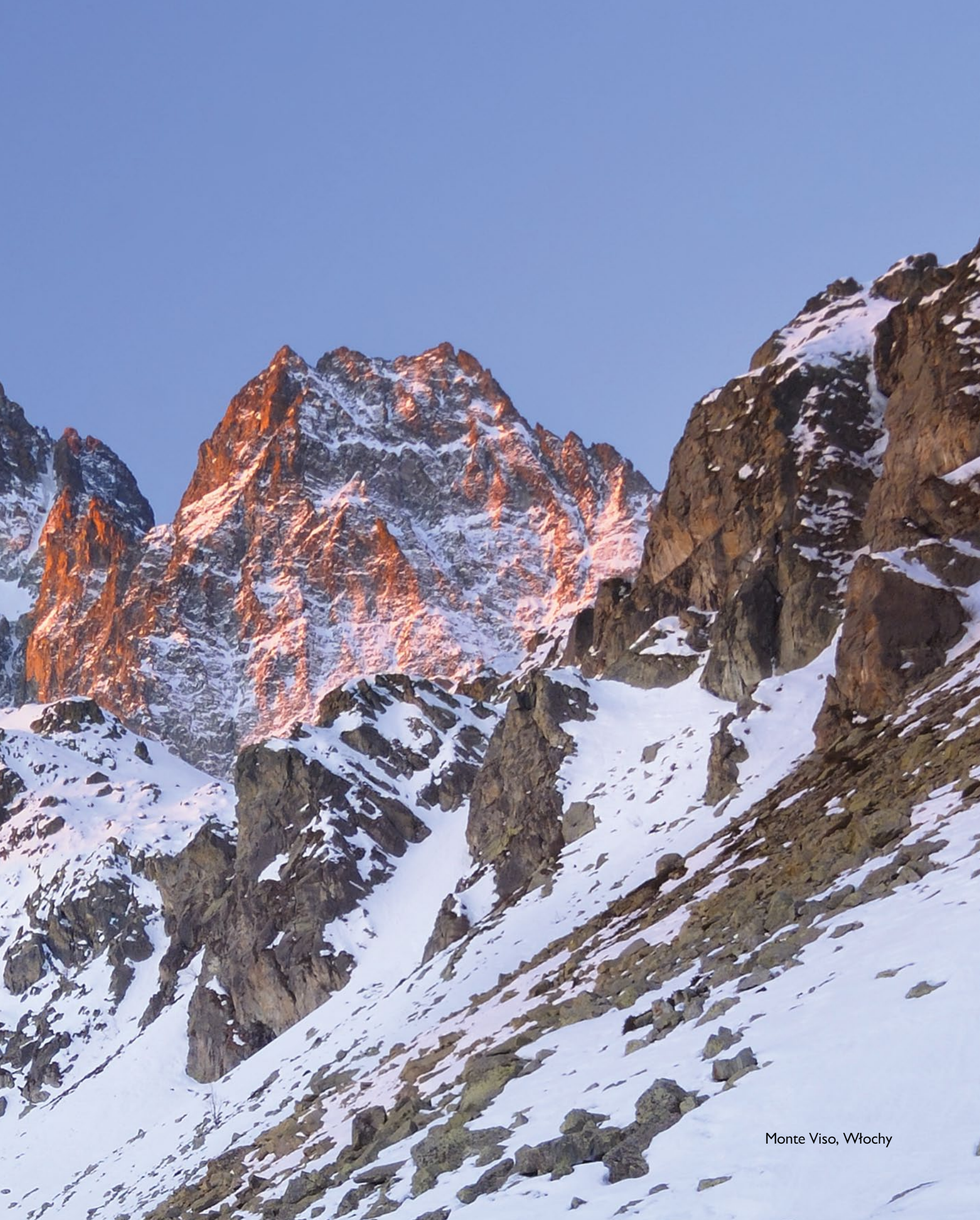
Monte Viso, Włochy