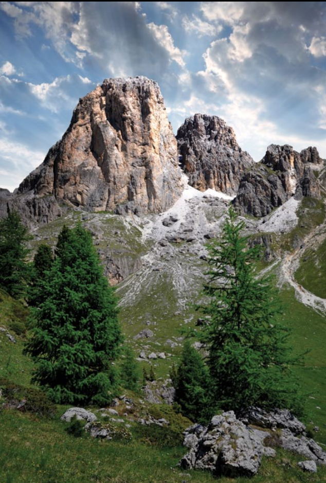
Val di Fassa w Dolomitach, Włochy