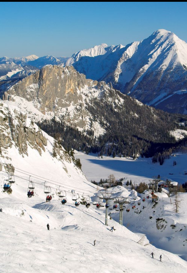
Wurzeralm w Północnych Alpach Wapiennych, Austria

R ozciągnięte łukiem długości 1200 kilometrów i szerokości 200–350 kilometrów od wybrzeży Morza Śródziemnego po Europę Środkową, zajmują powierzchnię około 220 tys km 2 . Położone są na terytorium Francji, Monako, Włoch, Szwajcarii, Lichtensteinu, Niemiec, Austrii i Słowenii. Często używane nazwy poszczególnych części pochodzące od kraju (np. Alpy Włoskie) nie mają większego sensu, gdyż granice polityczne zmieniały się tu bardzo często. Geografowie na podstawie rzeźby terenu podzielili je na Alpy Zachodnie i Alpy Wschodnie, rozdzielone wyraźnym ciągiem obniżień od Jeziora Bodeńskiego na północy przez dolinę górnego Renu, przełęcz Splügen, dolinę rzeki San Giacomo i jezioro Como na południu. W obu tych częściach wyróżnia się duże rejony zbudowane najczęściej z podobnych skał: Północne i Południowe Alpy Zachodnie oraz Centralne Alpy Wschodnie, Północne i Południowe Alpy Wapienne. Dopiero one dzielą się na grupy górskie, masywy i pasma. Szczegółowy podział Alp (SOIUSA) wymienia na poziomie naszych na przykład Gór Sowich lub Pienin 133 jednostki (na najniższym poziomie – 1625); niespecjaliści nie mają szans na ich zapamiętanie, więc nie będziemy ich wymieniać.