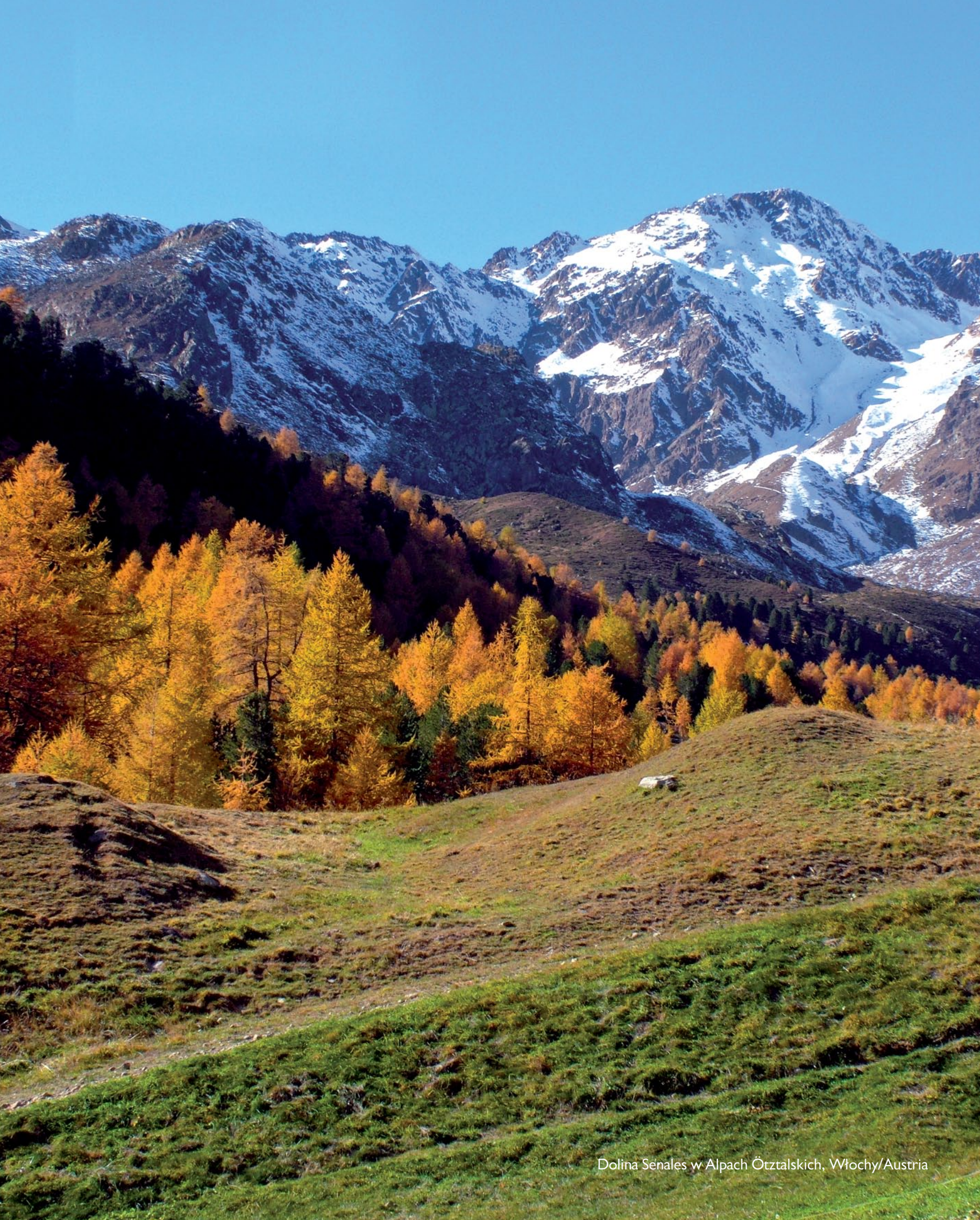
Dolina Senales w Alpach Ötztalskich, Włochy/Austria