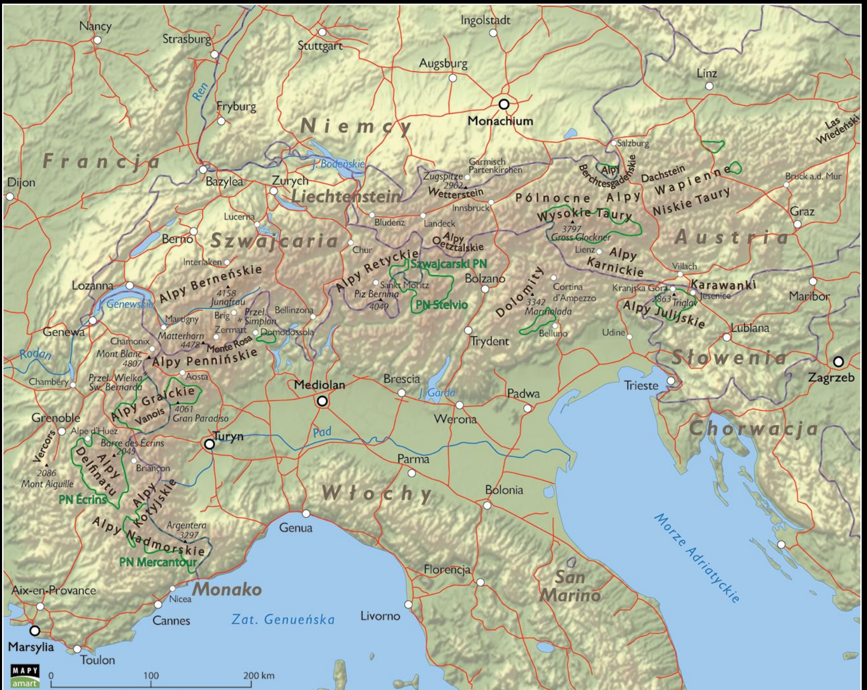
Monte Rosa, Alpy Szwajcarskie