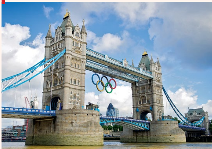
Tower Bridge podczas igrzysk olimpijskich w 2012 r.

Tak eksponowaną pozycję Londyn zachował w zasadzie do dziś, choć prymat na świecie Wielka Brytania już dawno oddała Stanom Zjednoczonym. Pomimo zniszczeń w okresie II wojny światowej (w niemieckich nalotach zginęło ok. 20 tys. mieszkańców, nie mówiąc o stratach materialnych) metropolia zachowała do dziś rolę jednego z najważniejszych ośrodków świata. Masowa migracja ludności z dawnych kolonii, zwłaszcza subkontynentu indyjskiego i basenu Morza Karaibskiego, sprawiła, że miasto zyskało charakter wielokulturowy i wieloetniczny. W dobie współczesnej najważniejszym wydarzeniem były chyba letnie igrzyska olimpijskie w 2012 r., zorganizowane w mieście po raz trzeci.