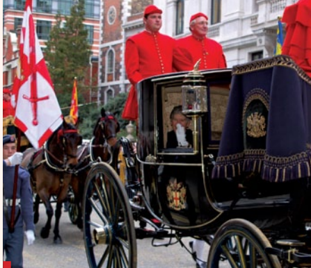
The Lord Mayor's Show

The Lord Mayor's Show (29 listopada) – jedna z najstarszych imprez ulicznych miasta, organizowana od 1535 r. Pośród tłumu londyńczyków w bogato zdobionej karocy podróżuje