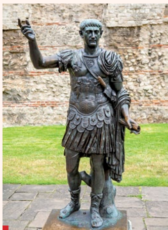
Posąg cesarza Trajana pod London Wall (fragmenty murów z czasów rzymskich)

Od III w. postępowała chrystianizacja wyspy, choć nie przebiegała ona gładko (pierwszy męczennik brytyjski św. Albin zginął z rąk pogan ok. 304 r.). Już w tym stuleciu ustanowiono w Londynie biskupstwo. Jeszcze za czasów Rzymian miasto stało się ważnym ośrodkiem brytyjskiego chrześcijaństwa, a londyńska bazylika była największą świątynią na północ od Alp.