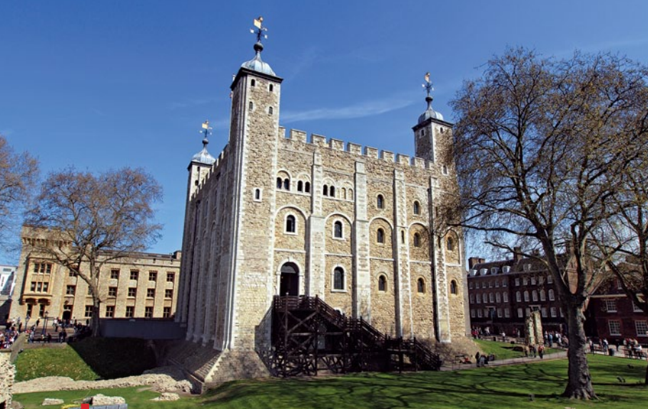
Budowę Białej Wieży, serca Tower of London, rozpoczął Wilhelm Zdobywca w 1070 r.

Rozwój Londynu ustał gwałtownie wraz z odejściem Rzymian w 410 r. Podobnie jak cała prowincja, miasto stało się łatwym łupem dla germańskich piratów. Na skutek licznych najazdów ludów anglosaskich już w połowie V w. w miejscu doskonale prosperującego ośrodka handlowego pozostały niemal wyłącznie spustoszone ruiny. Dopiero z końcem wieku powstało pierwsze anglosaskie osiedle. Londyn zbudowano na nowo, a wkrótce – tym razem pod nazwą Lundenwic – został stolicą anglosaskiego królestwa Essex.