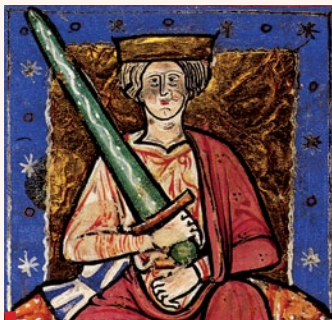
Król Anglii Ethelred II Bezradny ponownie ustanowił Londyn stolicą pod koniec X w.

Rozwój Londynu ustał gwałtownie wraz z odejściem Rzymian w 410 r. Podobnie jak cała prowincja, miasto stało się łatwym łupem dla germańskich piratów. Na skutek licznych najazdów ludów anglosaskich już w połowie V w. w miejscu doskonale prosperującego ośrodka handlowego pozostały niemal wyłącznie spustoszone ruiny. Dopiero z końcem wieku powstało pierwsze anglosaskie osiedle. Londyn zbudowano na nowo, a wkrótce – tym razem pod nazwą Lundenwic – został stolicą anglosaskiego królestwa Essex.