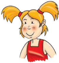
siostra - sister sister