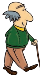
stary - old old