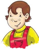
siostrzeniec - nephew nefiu