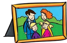
portret rodzinny - family portrait famili portret