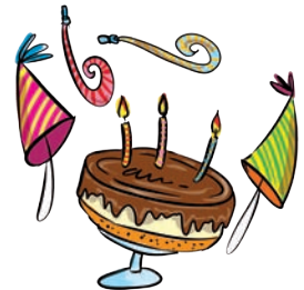
przyjęcie urodzinowe - birthday party bersdej party