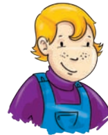
brat - brother brader