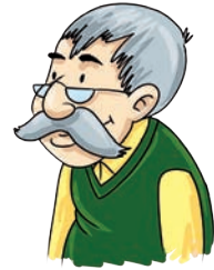
dziadek - grandfather grandfader