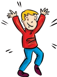
młody - young jang