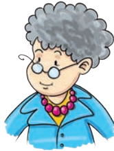
babcia - grandmother grandmader