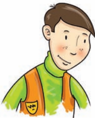
wujek - uncle ankl