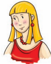
ciocia - aunt ant