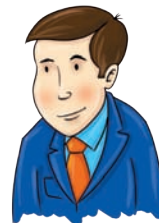
tata - father fader