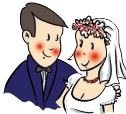
matężństwo - marriage merydż