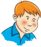
ja - me mi