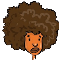
włosy – hair her