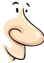
nos – nose nots