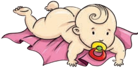
niemowlę - baby bejbi