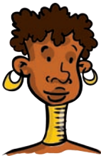
szyja – neck nek