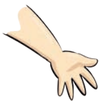
ręka – hand hend