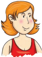
mama - mother mader