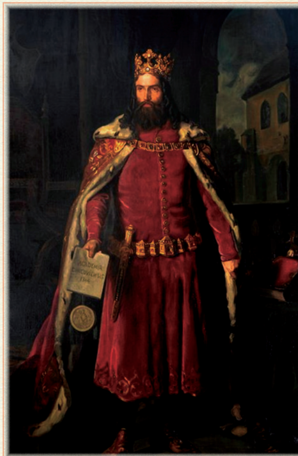
Kazimierz III Wielki, obraz Leopolda Löfflera