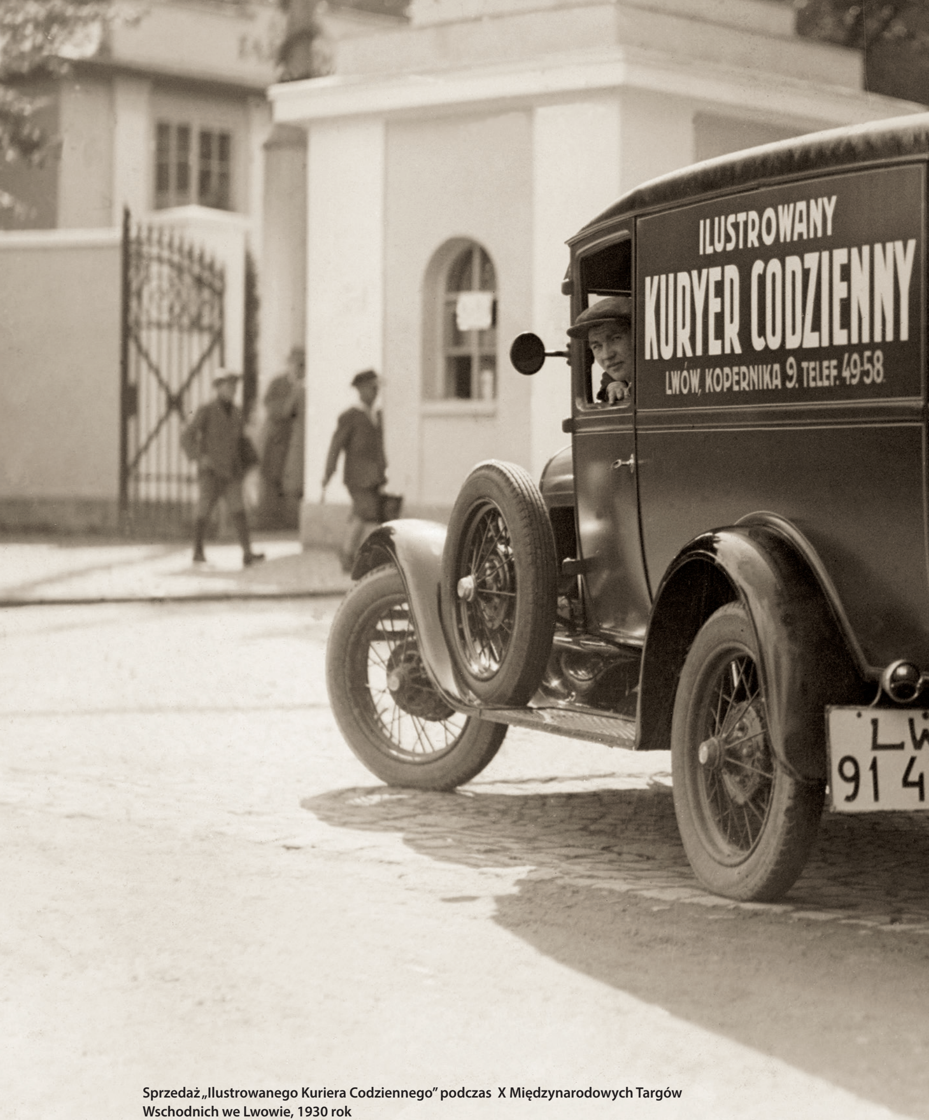
Sprzedaż „Ilustrowanego Kuriera Codziennego” podczas X Międzynarodowych Targów Wschodnich we Lwowie, 1930 rok