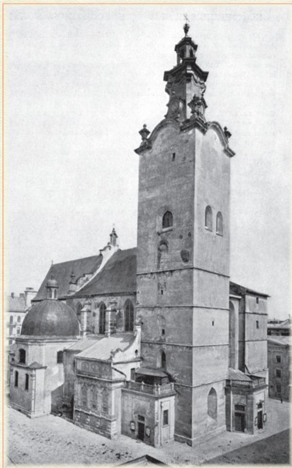
Bazylika archikatedralna Wniebowzięcia Najświętszej Maryi Panny we Lwowie zwana katedrą Łacińską, 1898 rok

Po śmierci Kazimierza Wielkiego Lwów wraz z Rusią Czerwoną stał się lennem Władysława Opolczyka z dynastii Piastów. Jego rządy okazały się dla miasta niezwykle szczęśliwe, m.in. uruchomiono mennicę bijącą srebrne półgrosze i miedziane denary, Lwów uzyskał prawo wolnego handlu z Węgarami, umocnił samorząd i mógł samodzielnie wybierać wójta. Gdy rządzący Polską po śmierci Kazimierza Wielkiego Ludwik Węgierski chciał oderwać Ruś Czerwoną od Polski i usunąć Opolczyka, Lwów otrzymał kolejne uprawnienia. Król Ludwik chciał