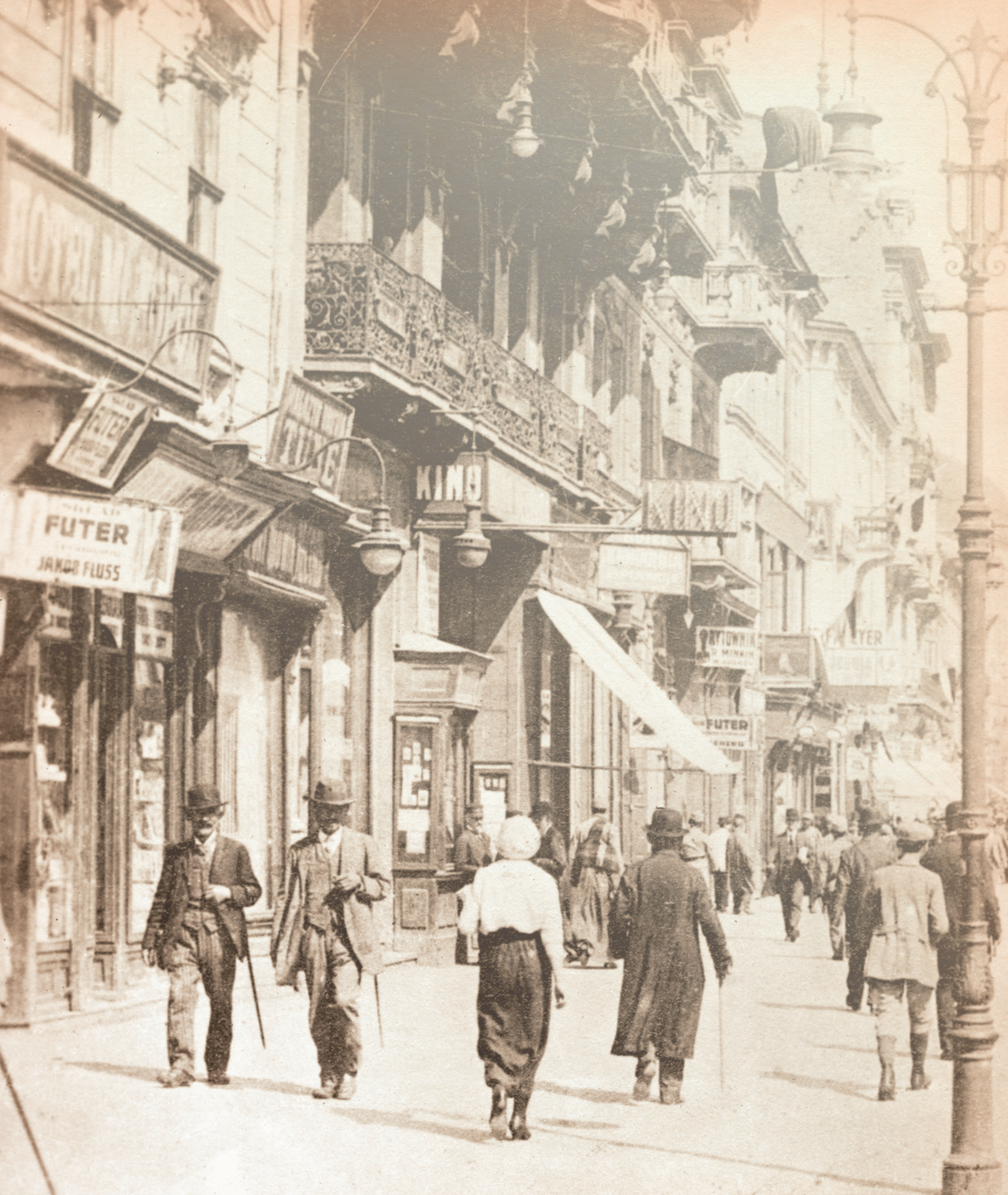
Lwów, Wały Hetmańskie, około 1900 roku