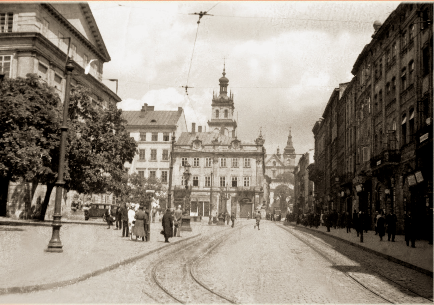
Rynek we Lwowie, 1932 rok

Miasto w swojej polskiej historii doświadczyło ośmiu ciężkich oblężeń i 21 najazdów, podczas których zniszczono przedmieścia. Było też świadkiem dwóch wielkich bitew, stoczonych pod jego murami. Lwów jako miejski organizm wykazywał niesłychaną żywotność. Wielokrotnie doświadczał pożarów, a mimo to zawsze odradzał się ze zgliszcz i popiołów. Jak obliczyli historycy, w czasach