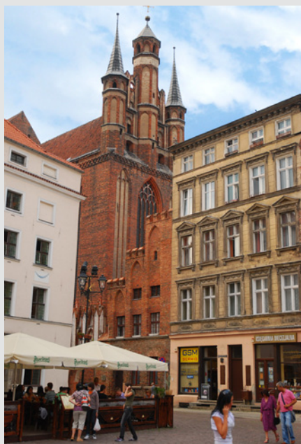
Kościół Wniebowzięcia NMP (Mariacki) od strony Rynku Staromiejskiego

KOŚCIÓŁ WNIEBOWZİĘCIA NMP (Panny Marii; zabytek klasy 0). Budowany przez franciszkanów od 1343 r. do końca XIV w. Gotycka, trójnawowa budowla halowa bez wieży z przyległymi zabudowaniami klasztorными. Od 1557 r. w rękach protestantów, jako świątynia ewangelicka i gimnazjum. Po „tumulcie toruńskim” w 1724 r. wszystkie obiekty przekazano katolikom i pieczy bernardynów. Po kasacie zakonu (1821 r.) świątynia służyła podmiejskiej parafii św. Wawrzyńca. Od 1852 r. – samodzielny kościół parafialny. Przepiękne wnętrze (długość 66 m,