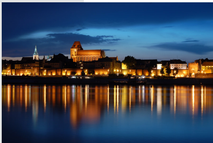
Panorama Torunia od strony wisły z widokiem Katedry św. św. Janów

królowie uczestniczyli w uroczystych nabożeństwach kościelnych. Tu w 1473 r. został ochrzczony Mikołaj Kopernik (kaplica Świętych Aniołów Stróżów, tzw. kaplica kopernikowska z gotycką chrzcielnicą z końca XIII w.). W okresie reformacji w 1530 r. świątynię zajęli protestanci, a od 1596 r. kościół przywrócono katolikom pod opiekę jezuitów, a po kasacie zakonu jezuitów w 1773 r. stał się kościołem parafialnym. W 1935 r. dekretem papieskim podniesiono go do rangi Bazyliki Mniejszej, a po utworzeniu w 1992 r. diecezji toruńskiej ze stolicą biskupstwa w Toruniu kościół stał się ka-