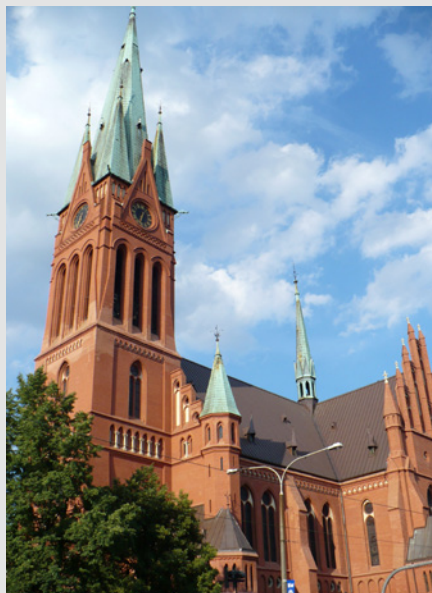
Kościół św. Katarzyny

głównej bogato rzeźbione organy z 1611 r. (balustrada z herbami Polski, Prus Królewskich, Starego i Nowego Torunia), XVII-wieczne stalle, rokokowa ambona, barokowy ołtarz główny z obrazem św. Jakuba. Wystrój pozostałych kaplic i ścian – na ogół barokowy. Zachował się również mur cmentarny.